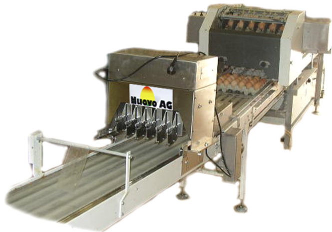
Egg-Jet Sprinter R6, Serie 20, auf Farmpacker